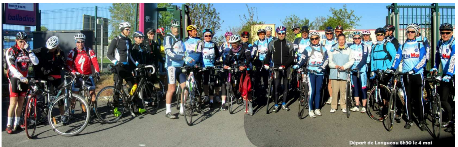
Départ de Longueau 8h30 le 4 mai