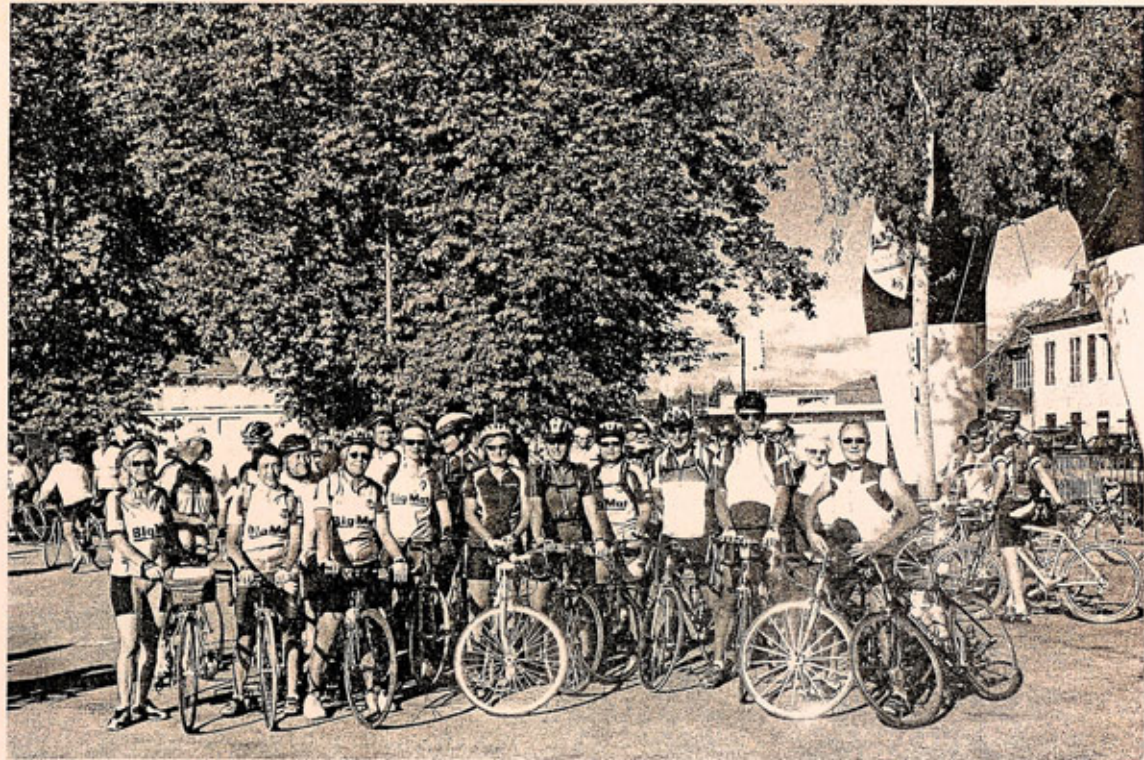
Oleron - Août 2005 -

La randonnée de EISENACH à SEDAN, -772 km- du 19 au 26 juin 2005, a marqué la volonté du Club de s'engager sur la voie d'échanges sportifs européens.